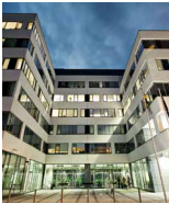
VIZIVAROS OFFICE CENTER Budapest Kapás u. 6–12