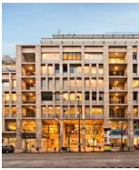
BARTOK HAZ Budapest Bartók Béla út 43–47