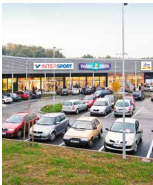
DUNA CENTER Budapest Győr