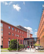
INFOPARK RESEARCH CENTER Budapest Infopark B, Neumann János U.

Logistik / logistics NF / EA: 64,500 m 2