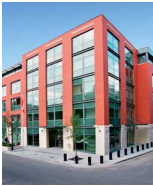
CANADA SQUARE Budapest Ganz u. 16