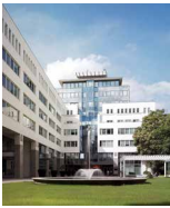
CITY GATE Budapest Koztelek u. 6