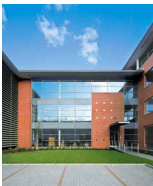
EUROPOLIS PARK AEROZONE 2) Vecsés Lorinci út 59–61

Logistik / logistics NF / EA: 64,500 m 2