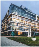
MILLENNIUM TOWER I Budapest Lechner Öden 6