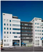
IP WEST Budapest Budafoki út 91–93