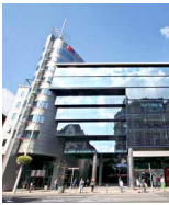
R 70 OFFICE COMPLEX Budapest Rákóczi út 70–72