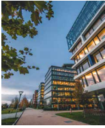
MILLENNIUM TOWER H Budapest Lechner Öden 10