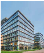
MILLENNIUM TOWER II Budapest Lechner Öden 7