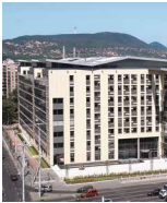
CAPITAL SQUARE Budapest Váci út 76